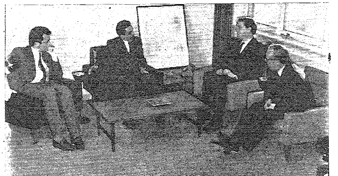
السيد صلاح ابو زيد وزير الثقافة الاعلام يتحدث الى اعضاء الوفد البرلماني البريطاني لدى زيارة الوفد للوزارة

عمان - جاتا من وزارة التربية والتعليم بابلي : يرجى من اولياء امور الطلبة المحتاجين في يوغسلافيا ان يبلغوا ابناءهم هناك ليراجعوا سفارة الجمهورية العربية المتحدة بلقراق للحصول على نصيبهم من المساعدات التي ارسلتها اليهم اخرا الجامعة العربية .